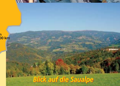
Blick auf die Saualpe